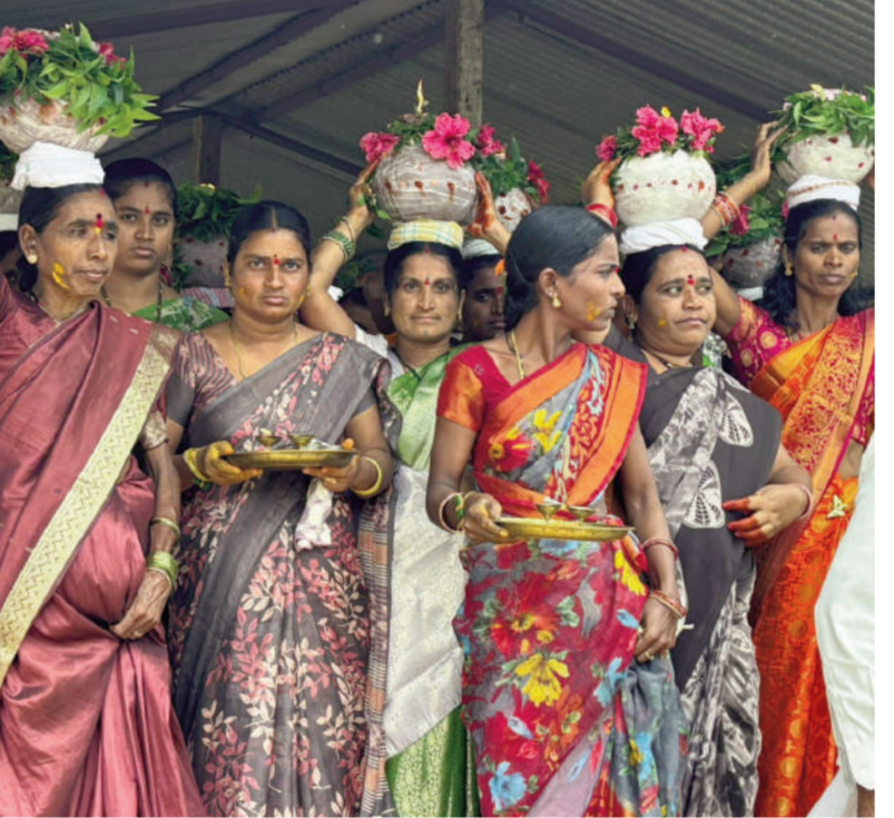
టైమ్స్ ఆఫ్ వార్త - బాన్సువాడ: