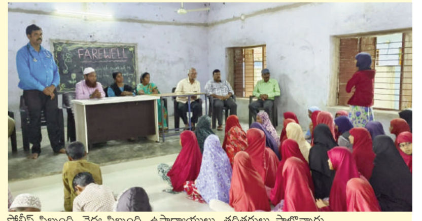
పోలీస్ సిబ్బంది, వైద్య సిబ్బంది, ఉపాధ్యాయులు, తదితరులు పాల్గొన్నారు.