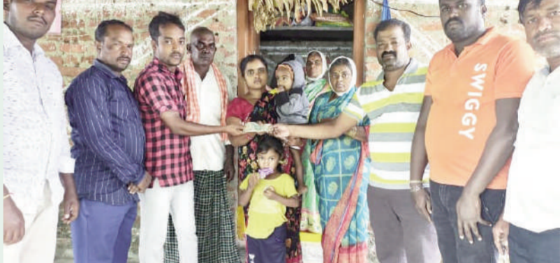
టైమ్స్ ఆఫ్ వార్త - భిక్కూర