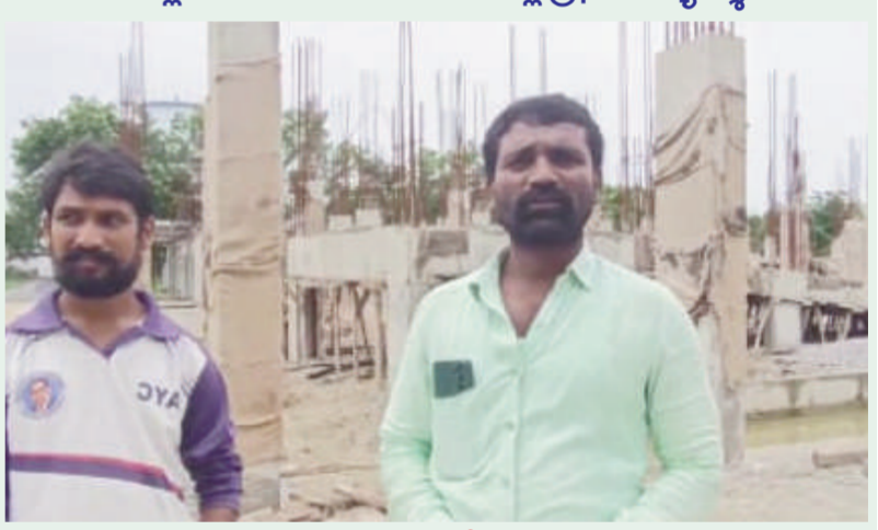
టైమ్స్ ఆఫ్ వార్త సూర్యాపేట జిల్లా ప్రతినిధి